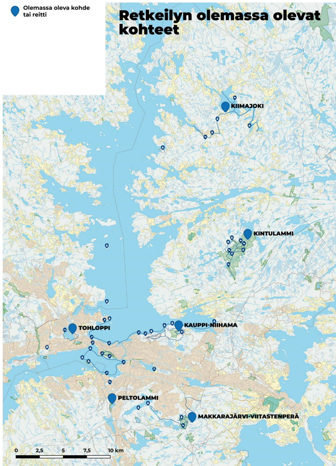
Kuva 4. Tampereen kaupunki retkeilypalveluiden olemassa olevat kohteet vuoden 2023 lopussa.