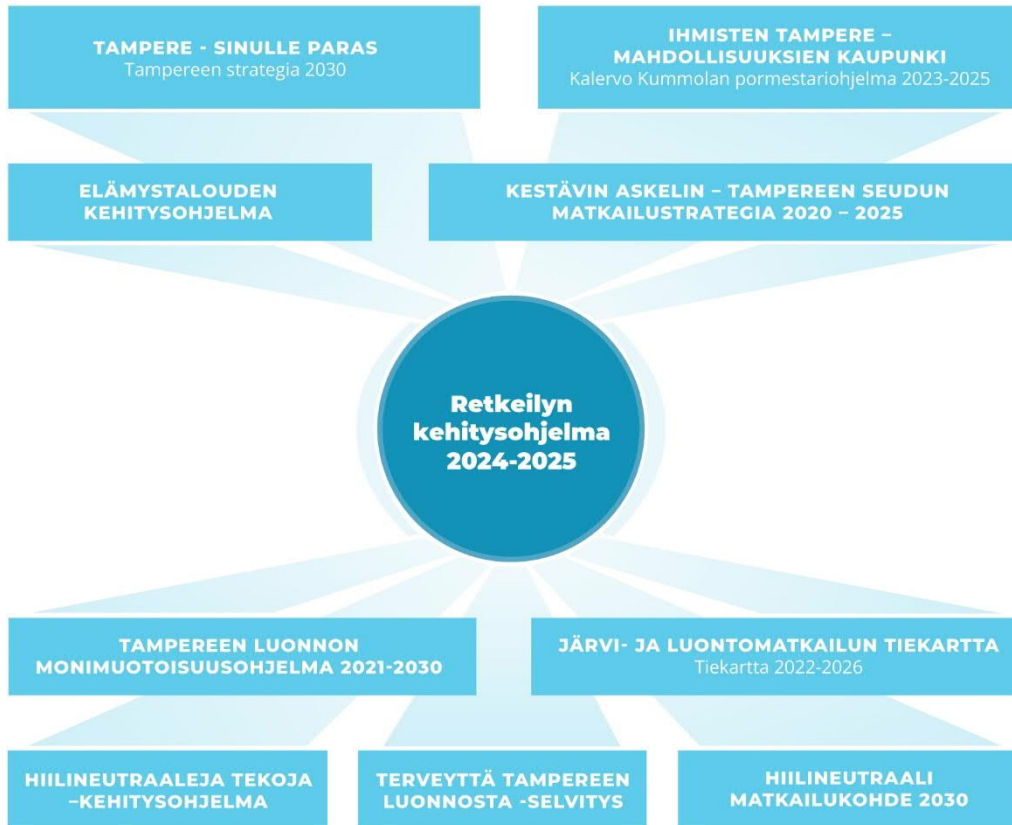
Kuva 2. Tampereen useissa strategioissa ja ohjelmissa viitataan luontoon ja retkeilyyn