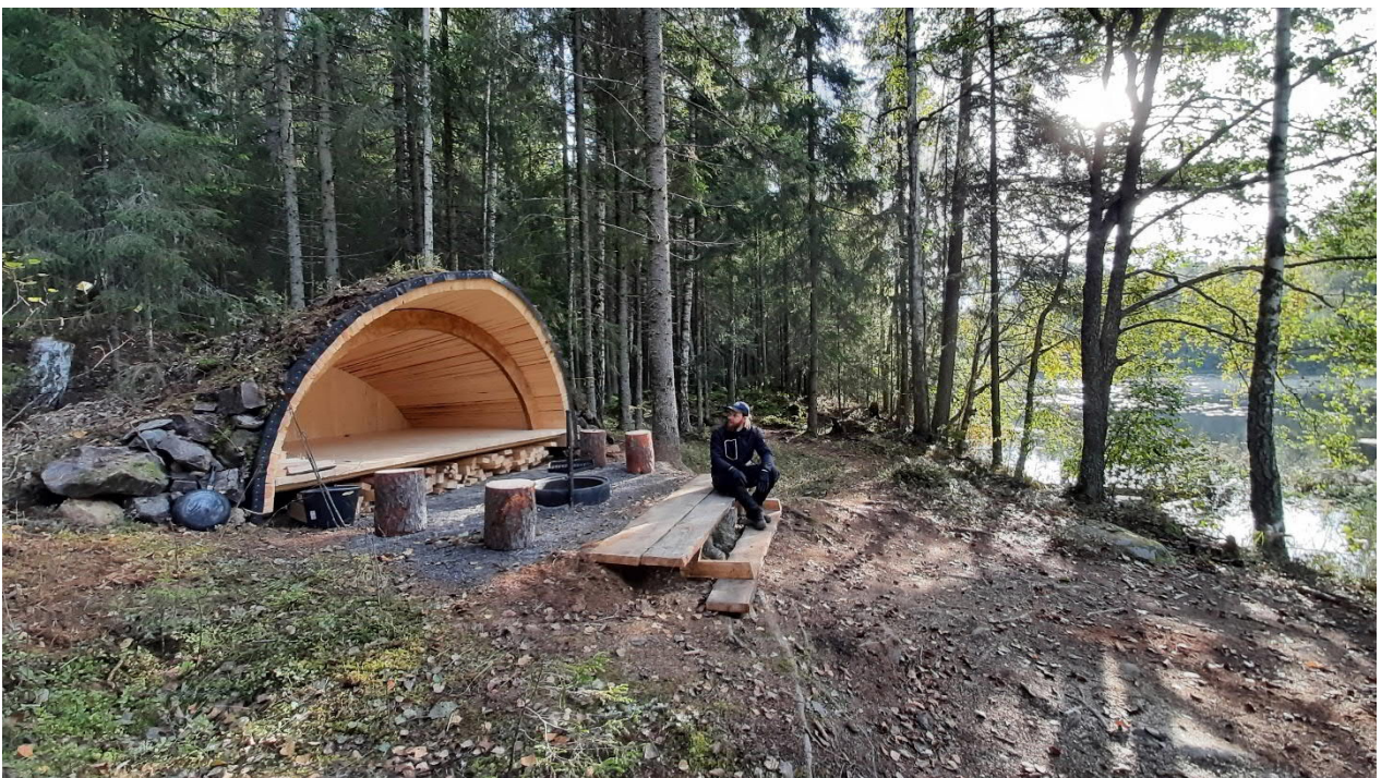
Kuva 3. Viitastenperän uusi laavu. Laavun on suunnitellut arkkitehti Malin Moisio ja se valmistui syksyllä 2021. © Petri Mäkelä