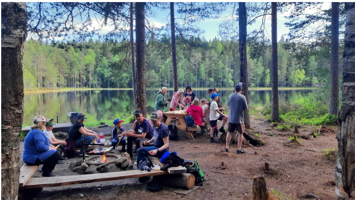
Kuva 1. Makkarajärven tulipaikasta on tullut suosittu kohde asukkaiden, koulujen ja päiväkotien keskuudessa. Tulipaikka sijaitsee vain 700 metriä ratikan Hervantajärven pääte pysäkillä.

Tampereen kaupungin retkeilypalveluiden järjestämisestä vastaa Kiinteistötoimi, joka tilaa palvelusopimuksella retkeilypalveluiden järjestämisen kaupunkikonsernin tytäryhtiö Ekokumppanit Oy:ltä. Retkeilypalvelut sisältävät monipuolisesti suunnittelua, toteutusta, ylläpitoa ja huoltoa sekä viestintää ja vuorovaikutusta. Palvelu järjestetään Retkeilyn kehitysohjelman ja vuosisuunnitelman mukaisesti sisältäen uusien kohteiden toteutuksen sekä olemassa olevan rakenteen ylläpidon. Uusien kohteiden toteutus alkaa suunnittelulla yhteistyössä kaupungin yksiköiden kanssa ja etenee sen jälkeen toteutukseen. Valmistuttuaan kohde tai reitti nostetaan esiin retkeilypalveluiden viestinnässä ja karttapalveluissa.