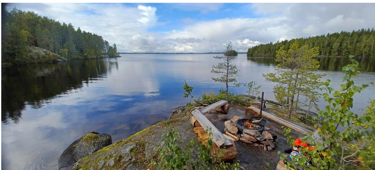
Kuva 7. Polsonlahden uusi nuotiopaikka sijaitsee luonnonkauniilla paikalla Maisansalon kupeessa

Esteettömien luontopalveluiden tarveselvitys ja kohteet on käsitelty ja hyväksytty Kiinteistötoimessa, ympäristönsuojeluyksikössä ja viheralueet ja hulevedet yksikössä. Selvitys esitellään Asunto- ja kiinteistölautakunnassa vuonna 2024. Jokaisen yksittäisen kohteen osalta tehdään erillinen toteutus päätös.