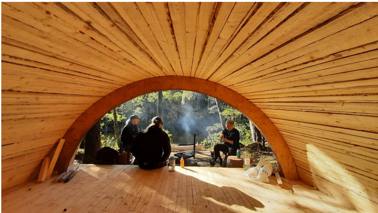
Kuva 5. Viitastenperän laavu sisältä kuvattuna.

Retkeilyn viestintä on nykytilanteessa hyvällä tasolla. Asukkaille ja matkailijoille on tarjolla ajantasaista ja monipuolista tietoa kaupungin retkeilypalveluista. Visit Tampereen viestintä nojaa Tampereella voimakkaasti luontoelämykseen ja kaupungin olemassa olevat retkeilypalvelut toteuttavat jo osan matkailijan toiveesta. Retkeilyn viestintää on kohennettu merkittävästi kahdella tapaa. Lokakuussa 2022 valmistui karttapalvelu, missä hallinnoidaan ja esitellään kaikkia Tampereen kaupunkiseudun ulkoilun ja retkeilyn rakennetta. Karttapalvelun osoite on https://ulkoilutampereenseutu.fi . Karttapalvelun tueksi julkaistiin vuoden 2022 lopussa Outdoors Tampere -sivusto osoitteessa https://www.outdoorstampere.fi/ . Verkkosivuilla esitellään kattavasti Tampereen kaupungin retkeilypalvelut.